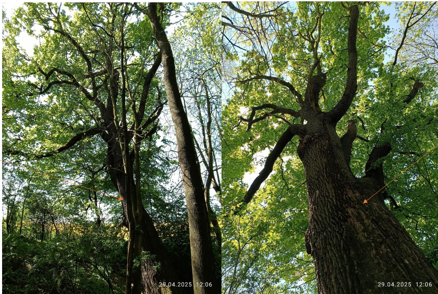
Dąb szypulkowy o obw. 480 cm