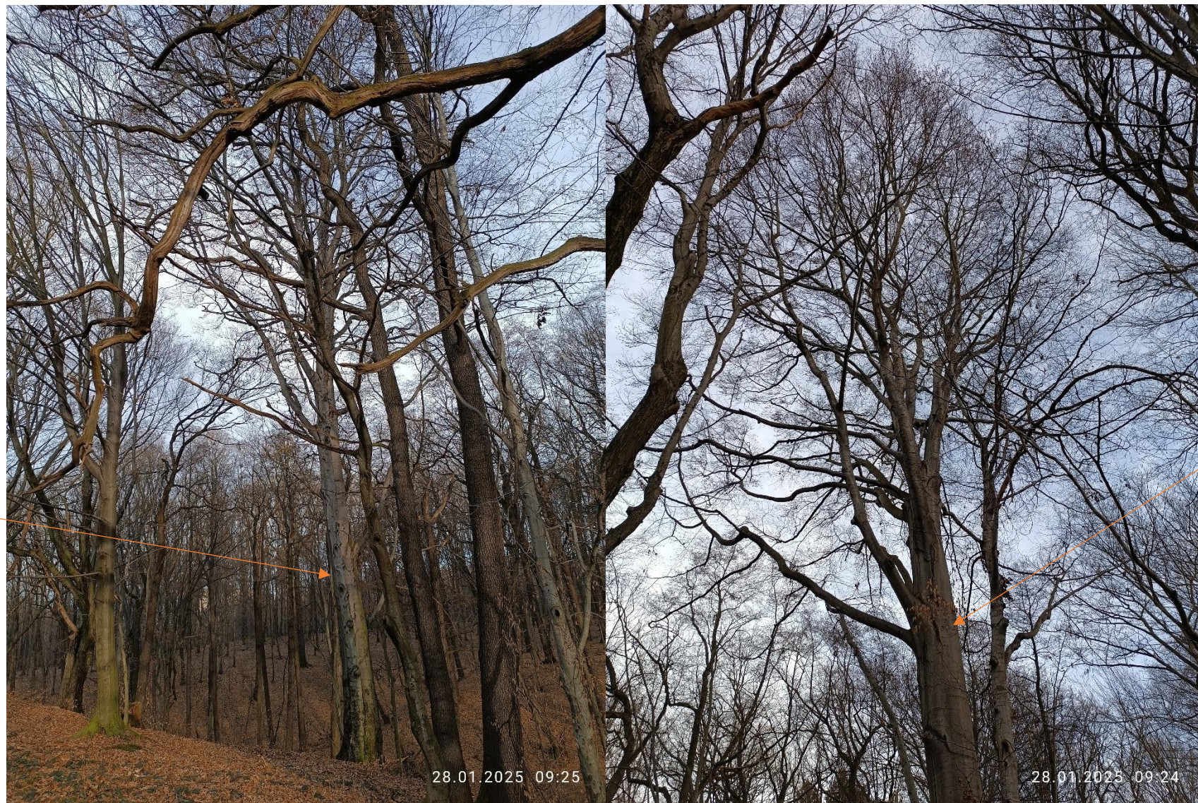
Buk pospolity o obw. 400 cm