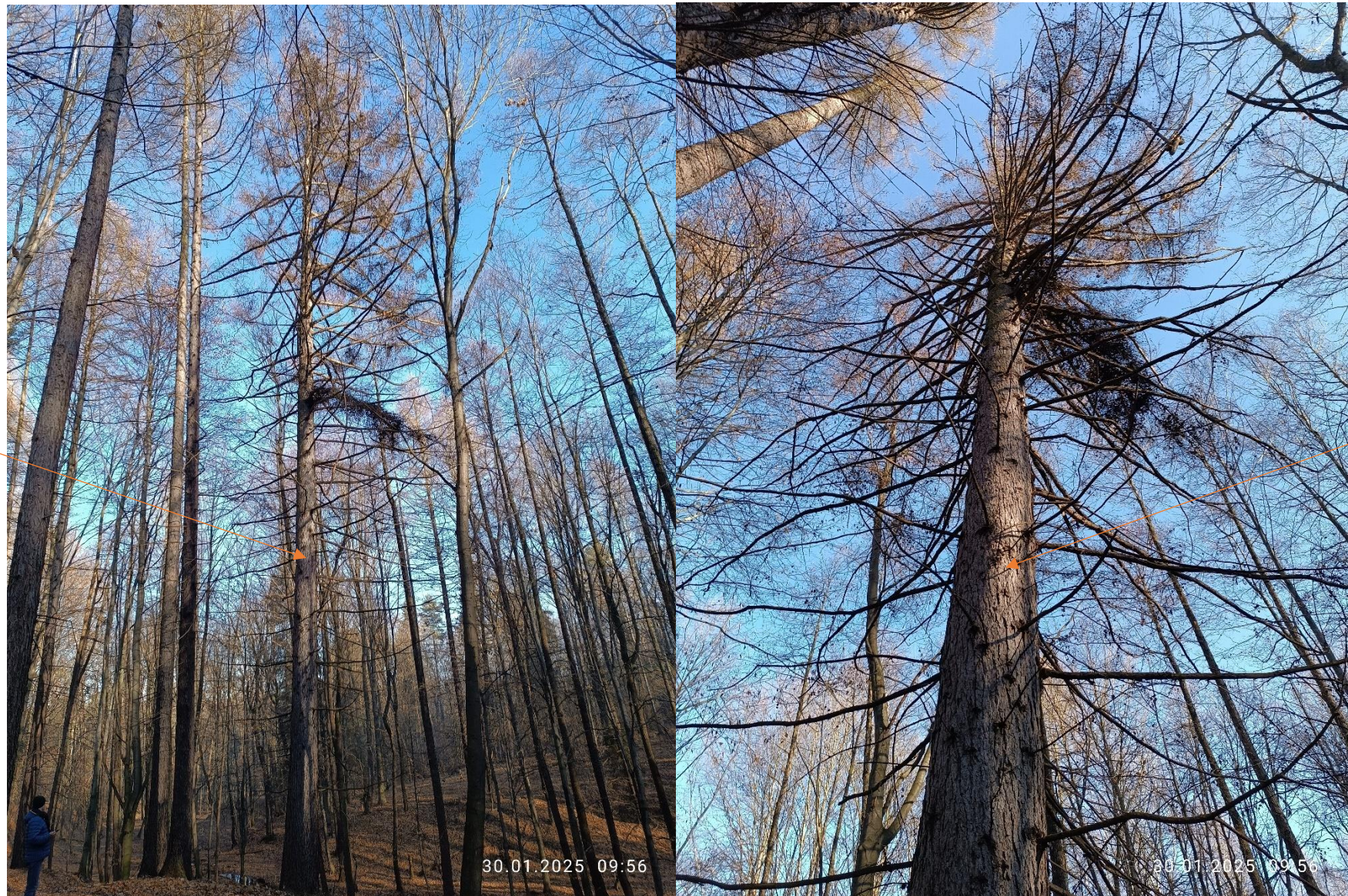
Modrzew europejski o obw. 310 cm