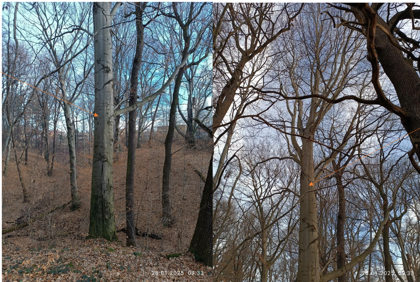
Buk pospolity o obw. 350 cm